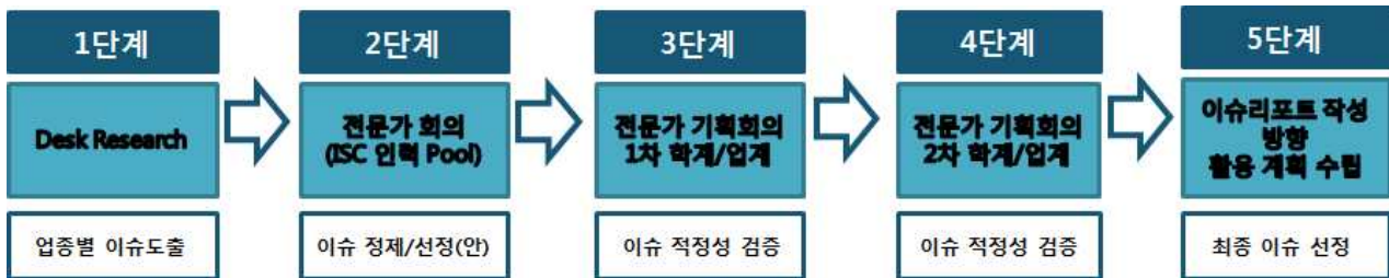
[그림1] 3분기 이슈리포트 주제 선정 프로세스